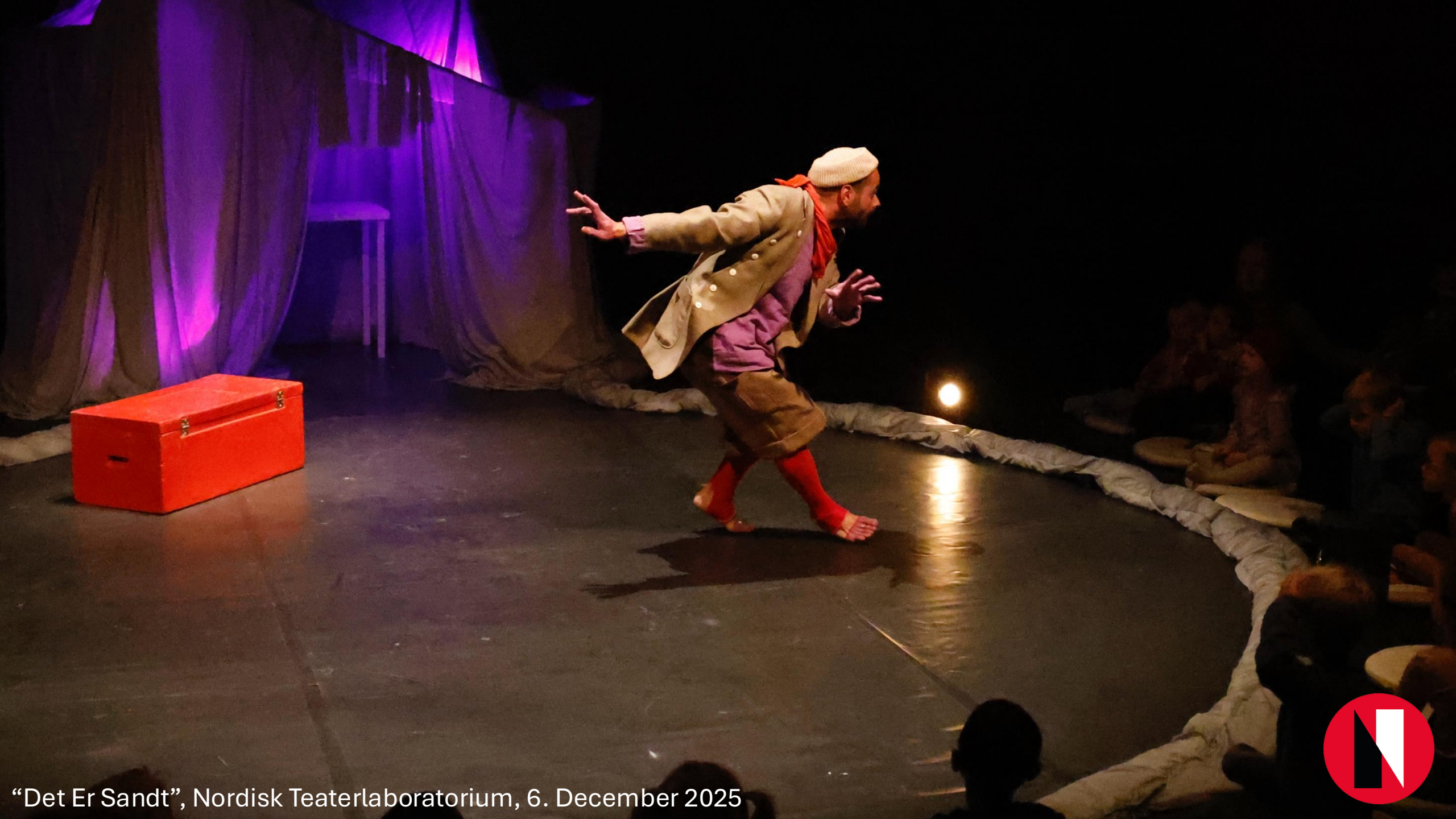
“Det Er Sandt”, Nordisk Teaterlaboratorium, 6. December 2025