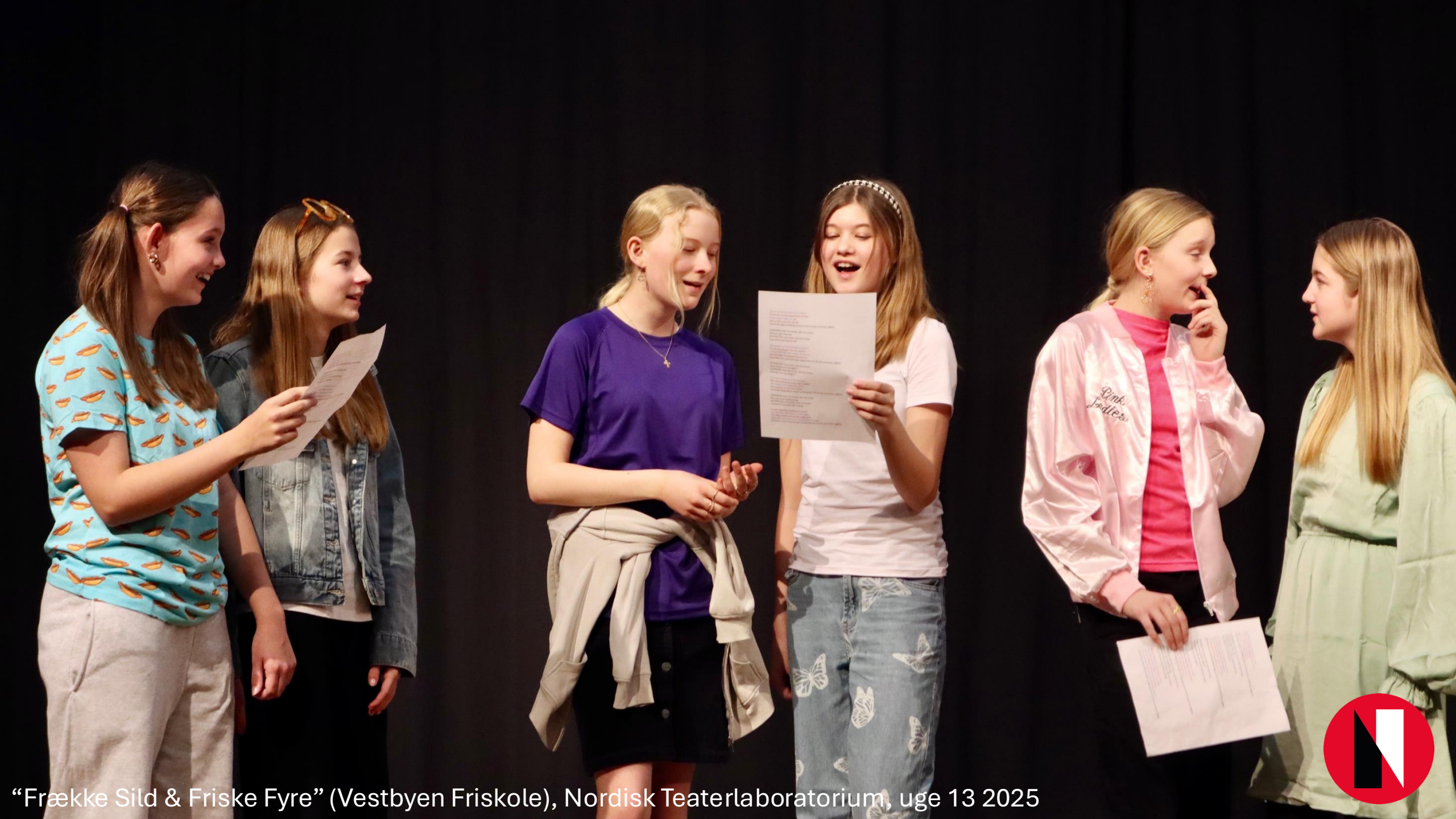
“Frække Sild & Friske Fyre” (Vestbyen Friskole), Nordisk Teaterlaboratorium, uge 13 2025