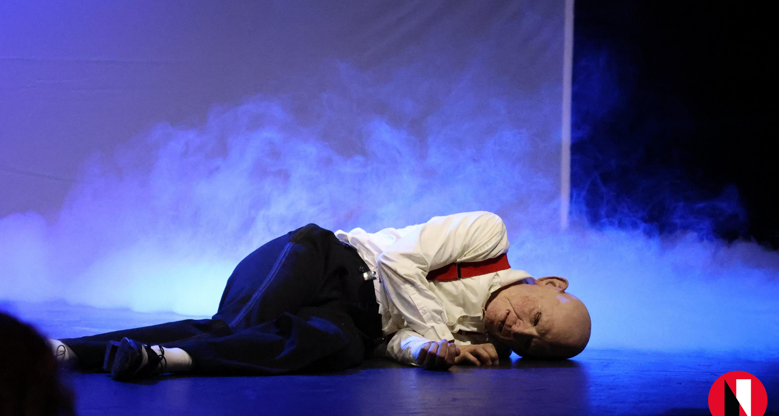
“Human Can”, Aveny-T (CPH Stage), 22. Maj 2025